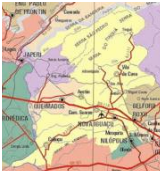
Mapa de Nova Iguazu, ainda contando com Mesquita

Nova Iguazu caracterizou-se como um grande produtor de cítricos, que teve o seu auge entre os anos de 1930 e 1950. Nessa época, Nova Iguazu era, inclusive, denominada de “Cidade Perfume”, devido à floração das laranjeiras. Com a Segunda Guerra Mundial e a conseqüente interrupção dos transportes marítimos, a exportação das laranjas sofre inúmeras dificuldades. A chamada “crise da laranja” originou o loteamento das áreas de laranjais e o início do processo de industrialização.